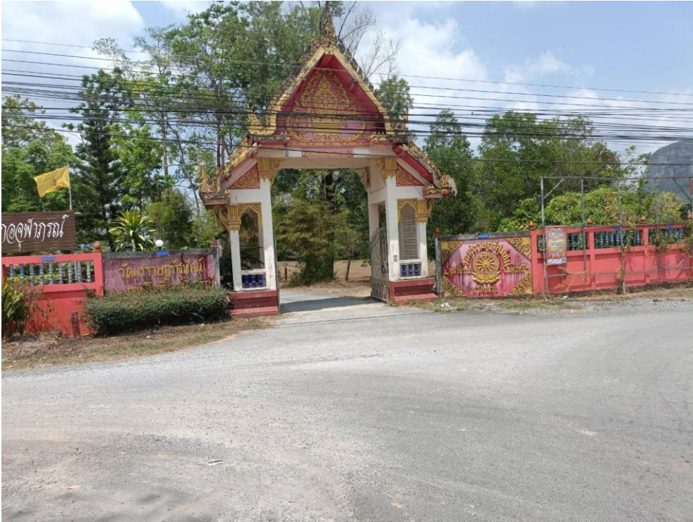
วัดแร่ราษฎร์สุทัศน์ ม.๒