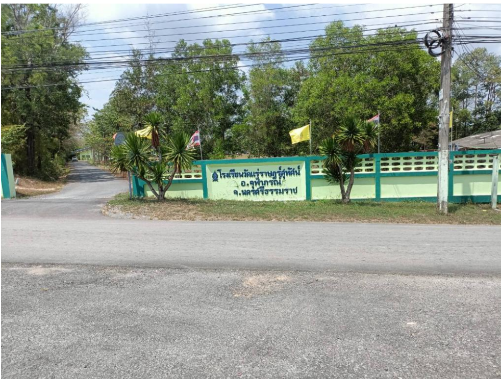
โรงเรียนวัดแร่ราษฎร์สุทัศน์ ม.๒