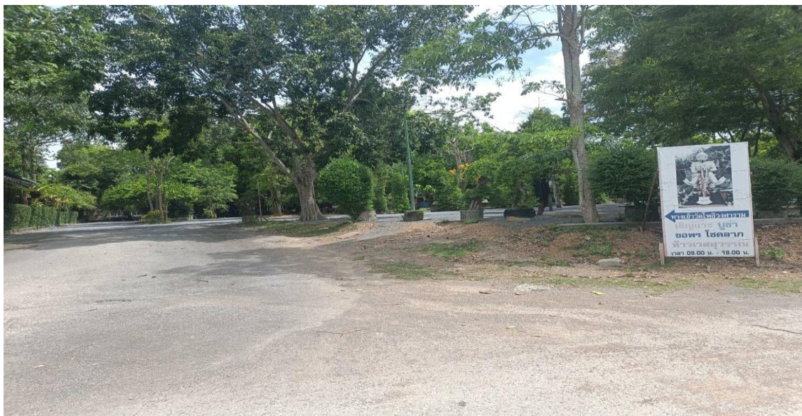
วัดทุ่งโพธิ์