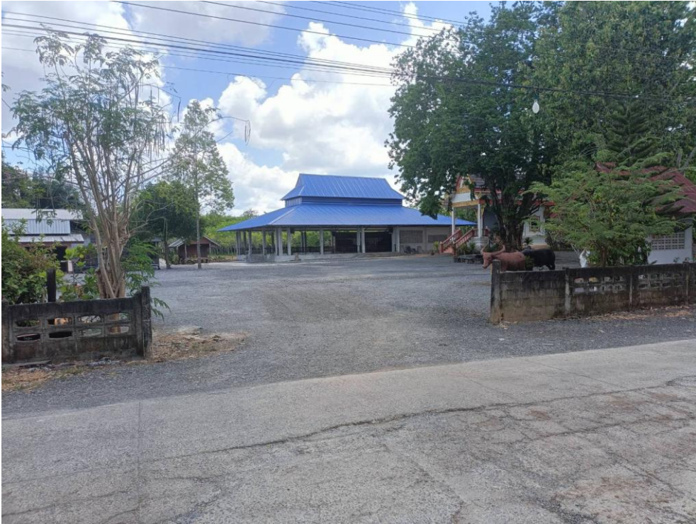
วัดป่าโทก ม.๖