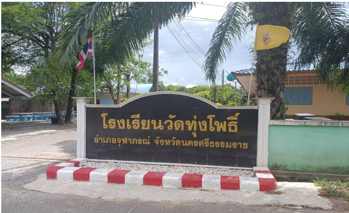
โรงเรียนวัดทุ่งโพธิ์