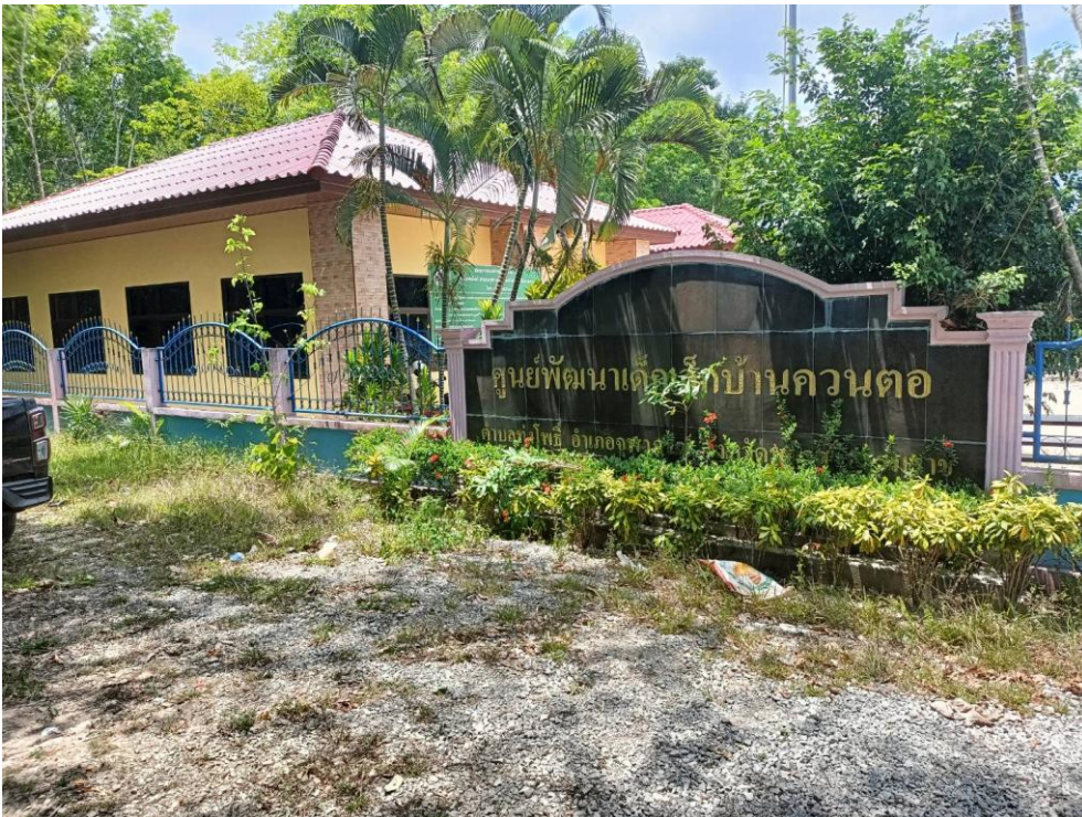
ศูนย์พัฒนาเด็กเล็กบ้านควนตอ