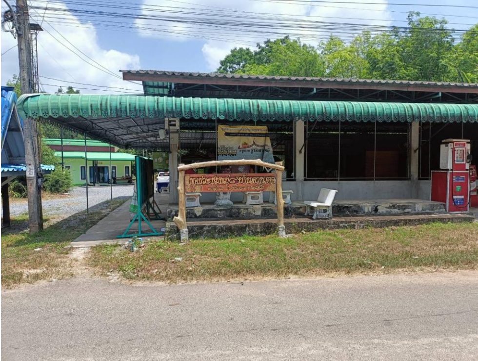
ศาลาประชุมหมู่บ้าน ม.๘