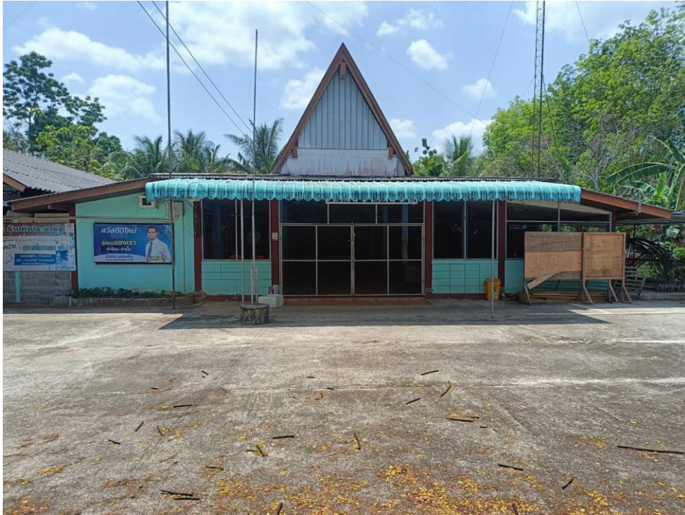
ศาลาประชุมหมู่บ้าน ม.๓