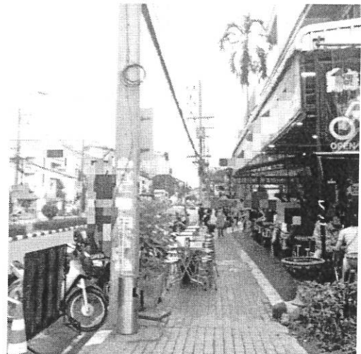
ภาพที่ ๘ บริเวณถนนห้วยแก้ว จ.เชียงใหม่ วันที่ ๒๕ สิงหาคม ๒๕๖๐