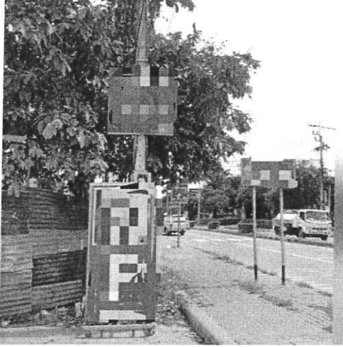
ภาพที่ ๕ บริเวณถนนเลี้ยวเมืองปากเกร็ด จ.นนทบุรี วันที่ ๒๔ สิงหาคม ๒๕๖๐