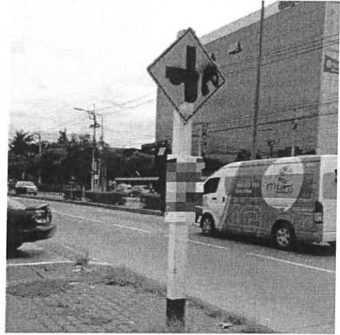
ภาพที่ ๖ บริเวณถนนเลี้ยวเมืองปากเกร็ด จ.นนทบุรี วันที่ ๒๔ สิงหาคม ๒๕๖๐