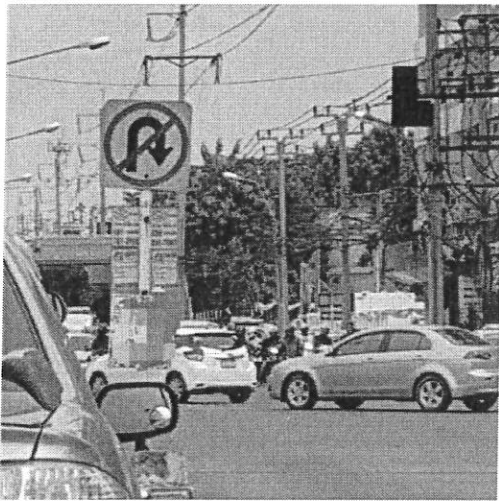
ภาพที่ ๗ บริเวณแยกสนามบินน้ำ จ.นนทบุรี วันที่ ๒๔ สิงหาคม ๒๕๖๐