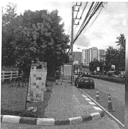
ภาพที่ ๙ บริเวณถนนห้วยแก้ว จ.เชียงใหม่ วันที่ ๒๕ สิงหาคม ๒๕๖๐