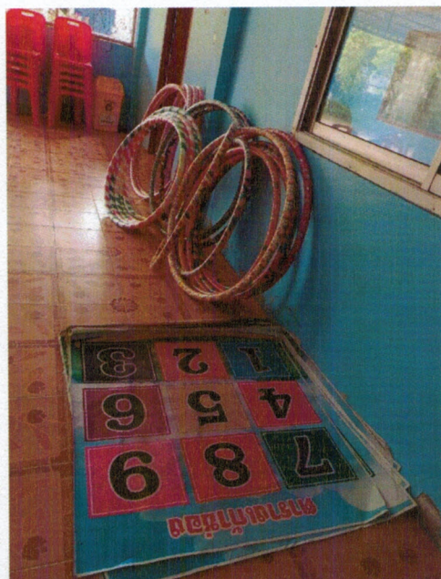
กิจกรรมโครงการ